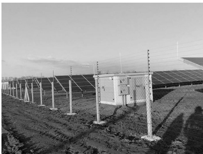
Molnár Bálint polgármester