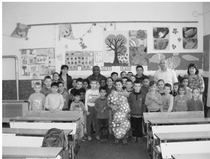
Szerkesztőség